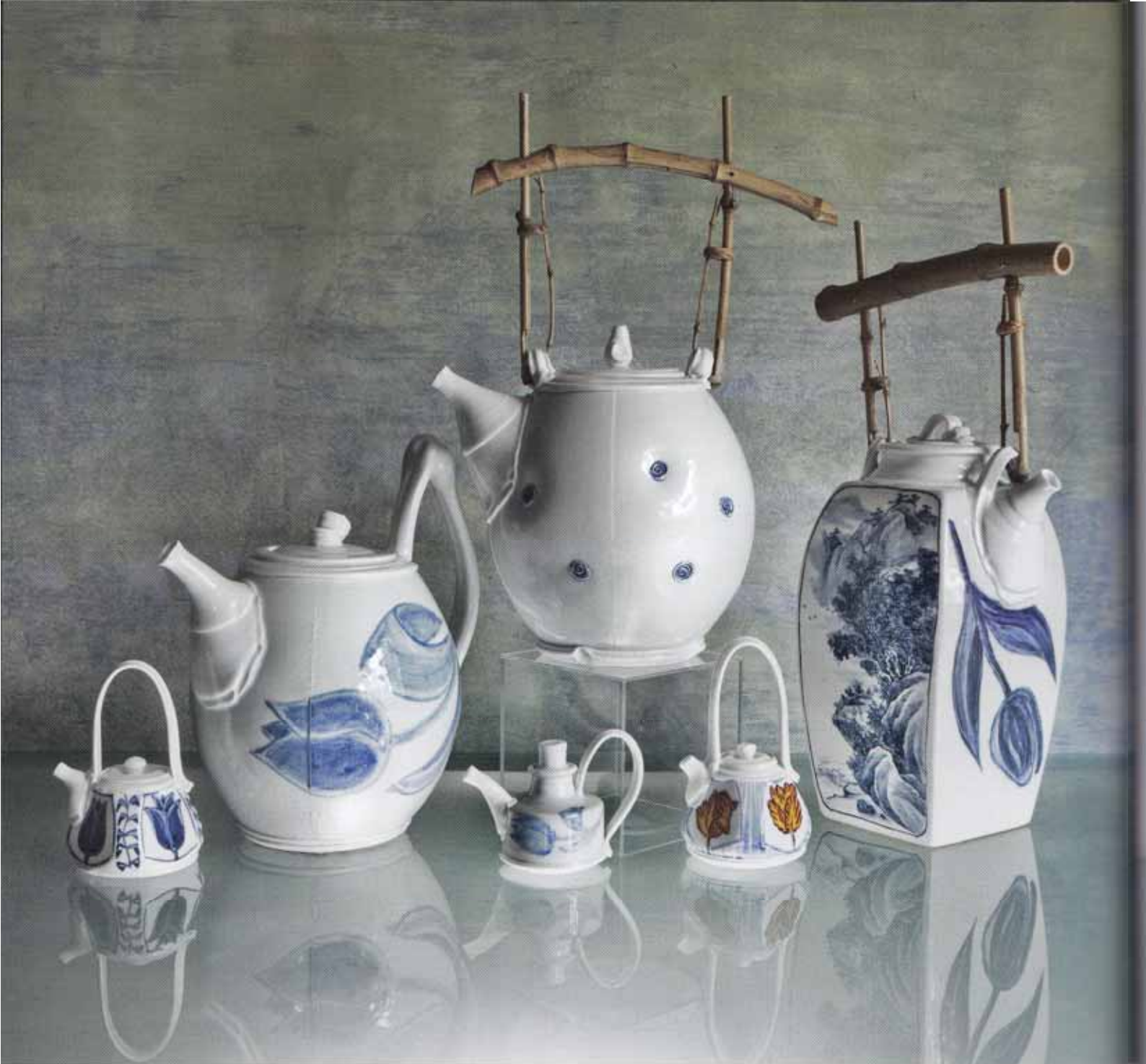
▲ Porselein uit Jingdezhen (China), 2012, techniek: gieten, gecombineerd met draaien ► Pompoenpotten, blanc de Chine porselein, gedraaid, h 14 en h 18 cm

Daar gaat het om, dat je wat je doet, elke keer dat je het doet... toch telkens voor de eerste keer doet. Ik heb omarmd dat vrijheid in mijn werk niet zoiets is als 'zonder grenzen alles kunnen doen'. Maar dat voor mij vrijheid is: mijn grenzen eerst te kennen (het wiel, de containervorm) en vervolgens mij binnen die grenzen volledig vrij te bewegen.