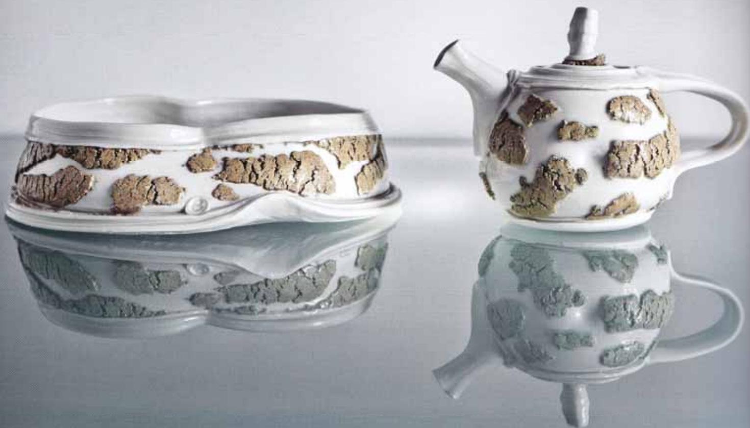
▲ Theeset, (theepot h 13 cm en saggavorm h 7 cm), blanc de Chine porselein en lokale Chinese steengoedklei (gewalkt door buffels)

grenzen die je zelf kiest, om dan binnen die grenzen te kijken hoe je die ruimte in totale vrijheid beleven kunt. Toen ik dat begreep hoefde ik niet meer van mijn draaischijf af en ervoer ik de containervorm ook niet meer als te beperkt. Nee, ik voelde me juist bevrijd van al die vooroordelen en kon heerlijk gaan kijken naar waar het accepteren van deze beperkingen mij allemaal heen zou leiden. En zo ontstond een never ending story van vragen: