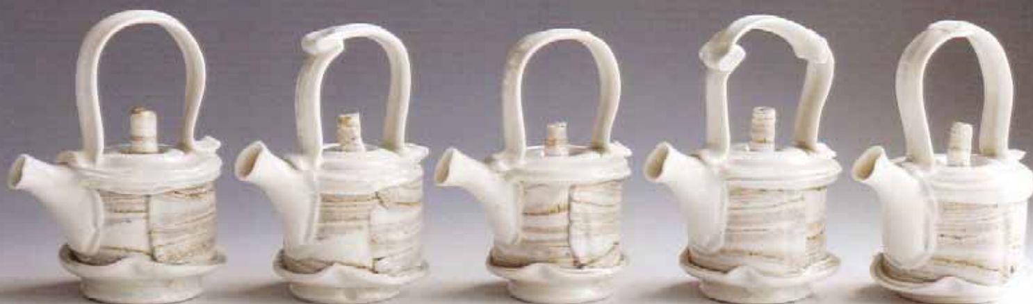
Tineke van Gils, Honeydew 1 t/m 5 (uit Mellow Series ), 2010; blanc de Chine; max. h. 14 cm

“Mijn theepotten zijn sculpturen, maar als je er thee mee wilt schenken moet dat wel feilloos gaan.”