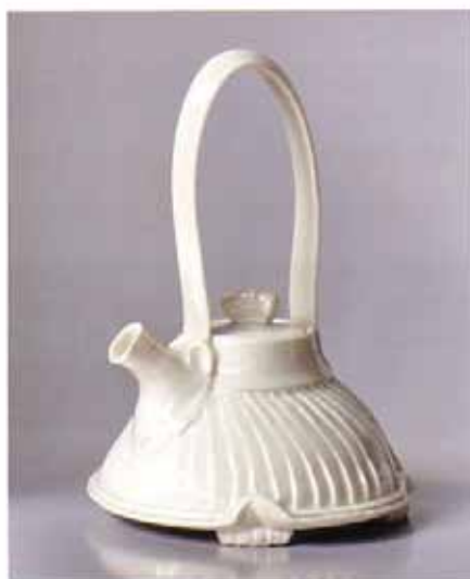
Tineke van Gils, White Swan (uit Ballet Series ), 2010; blanc de Chine ; h. 18 cm.