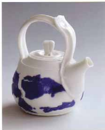
Tineke van Gils, Heavy Clouds (uit Sky Series ), 2010; blanc de Chine ; h. 13 cm.