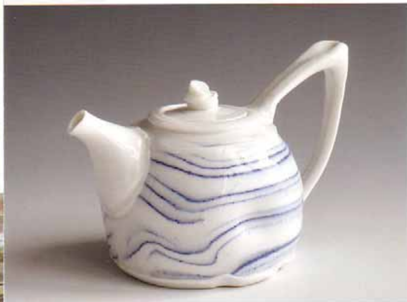
Tineke van Gils, Blue Waves (uit Mellow Series ), 2010; blanc de Chine; h. 12 cm