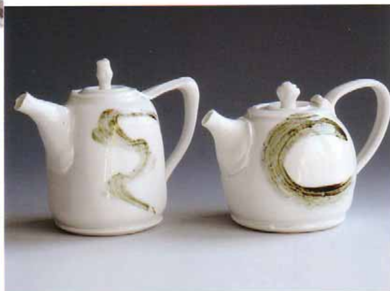
Tineke van Gils, Dreams are a Guide en My Lovers Heart (uit Emotion Series ), 2010; blanc de Chine; h. 13 cm en 11 cm.